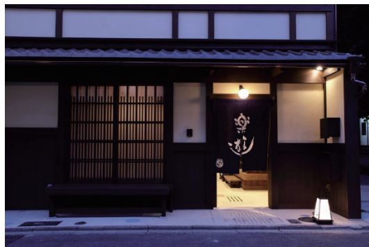
京町家 楽遊 堀川五条（京町家 楽遊 堀川五条Facebookより）

京町家 楽遊 堀川五条は、京町家を再現して2016年に創業した木造2階建て11部屋の小宿である。京町家 楽遊 堀川五条の部屋は昔ながらの小さい畳の和室に卓袱台と座布団があり、押し入れには布団や作務衣などが備えられ、戸口の高さは180センチ程といった規格が、昔の京町屋を感じさせる。和室の畳で外国人宿泊客の子供は寝ころび、大人は家具を自由勝手に柔軟に動かせる点で好まれている。全室ユニットバス・トイレを備えているものの、入浴はフロントで提供される無料入浴券をもって、向かいの銭湯を楽しむ客が多い。堀川五条は京都市の中でも市民が暮らす普通の住宅街であり、京都の主要な観光スポットへは地下鉄やバスを利用して行く。伝統の京町家を新築から忠実に再現した京町家 楽遊 堀川五条では、朝は京都名物の食材を主とした朝食、昼は観光地巡り、夜は向かいの銭湯の電気風呂に入り、和室で布団を敷いて寝るといった京都の町中で暮らすように宿泊できる。新型コロナウイルス蔓延以前の京町家 楽遊 堀川五条の客層は7~8割が外国人であり、国別では中国からの客が最も多いものの、全体的にヨーロッパ地域の国からの客が多かった。外国人客向けに特別なサービスやマーケティングをしていないにもかかわらず、Tripadvisorの「外国人に人気の日本の旅館 2020」では2位にランクインした。