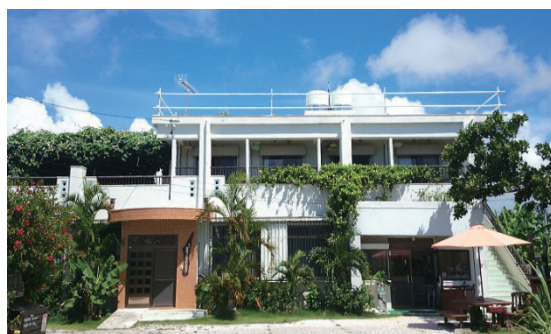
白保フレンドハウス（白保フレンドハウスのホームページより）

バックパッカーとして世界を旅していたオーナーは、自分が異国の旅先で困っていたようなことについて、日本で外国人客を助けてあげることが白保フレンドハウスの思いやりと考えている。日本を旅する不安な外国人客にとって、自分が日本人の代表であり、日本人の第一印象となる。外国人客と接する際に不躰な対応をして、日本人は不親切で嫌な国民として見られたくない、といった思いがある。だからといって、白保フレンドハウスでは、外国人宿泊客のた