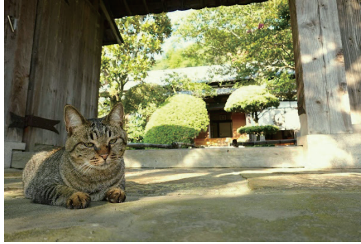
宿坊対馬西山寺

も、その宿泊体験を韓国語でSNSや口コミサイトへ紹介するようになり、特に韓国からの若い個人客が増えていった。宿坊対馬西山寺は、海外の旅行予約サイトでも紹介され、新型コロナウイルス蔓延前までは、台湾、タイ、他の東南アジア諸国からも訪れ、楽天トラベルの「訪日旅行（インバウンド）に人気の小規模宿ランキング」の3位にランクインしたこともある 5 。