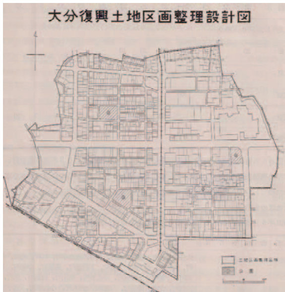
図3 大分復興土地整理設計図