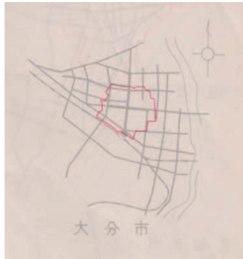
図1 計画街路図 縮尺100,000分の1

上下水道計画では、復興区画整理区域を給水区域及び排水区域とし、配水管延長は33,528m、下水道延長は25,000mの整備を行っている。