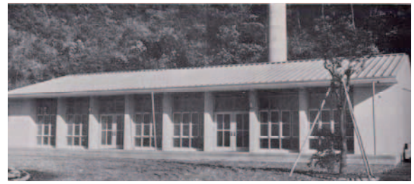
図5 大分市東部火葬場

「高崎山自然動物公園」の整備は、文献5)での『復興大分市の新施設』としての紹介をはじめ、大分市関連史料に