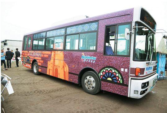
図5. 西鉄フルラッピング・バス