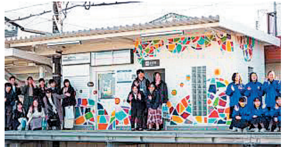
図3. 大堰駅ペイント完成