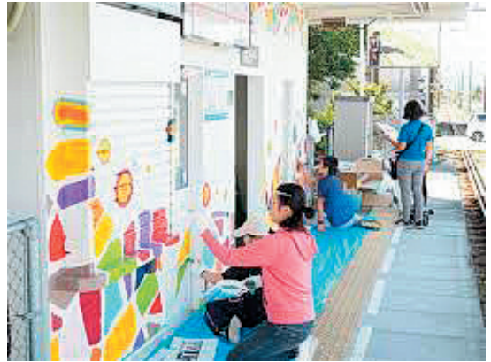
図2. 大堰駅ペイント風景

「大堰駅」のペイントの進捗状況から結果まで学生の活動はすべて動画で記録し2019年度末の展示で公開した。