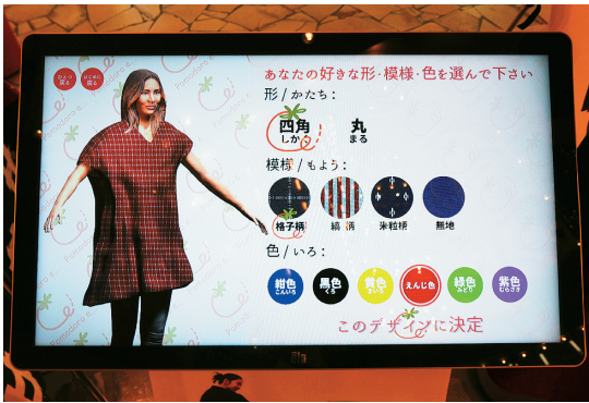
図1 久留米織チュニック・デザインシミュレーター